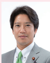
岡田 康裕 氏 衆議院議員