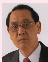
渡海 紀三朗 氏 元文部科学大臣